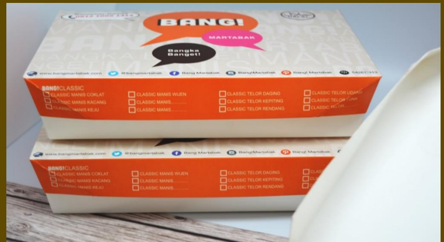
kemasan ukuran PLT : 24 x 15 x 5.5 cm