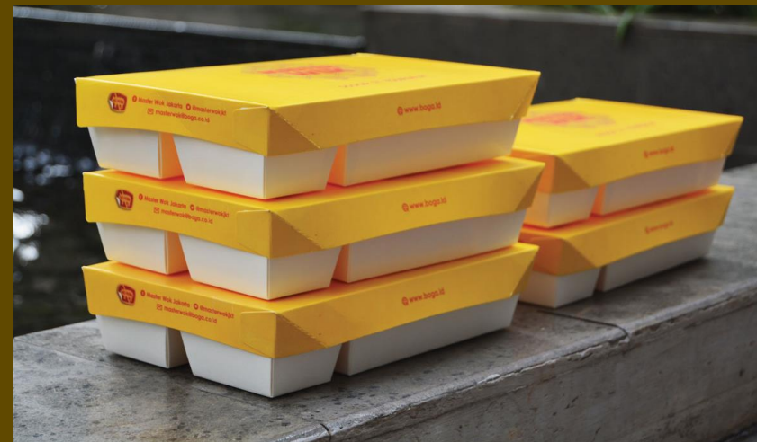
kemasan ukuran PLT : 23 x 14 x 5.5 cm