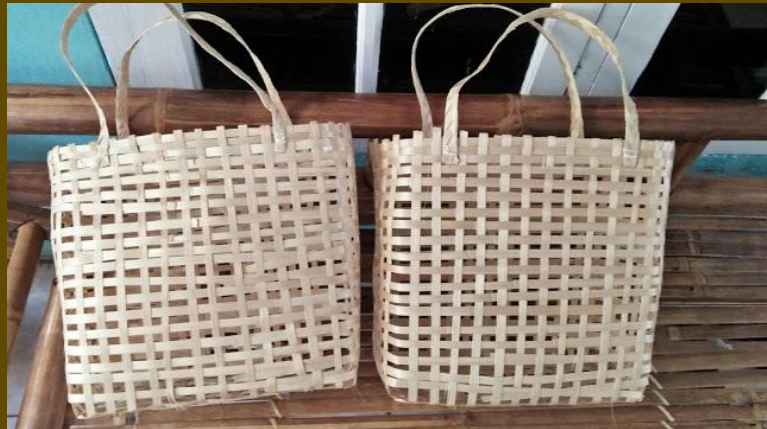
Keranjang Anyaman Bambu untuk Kemasan