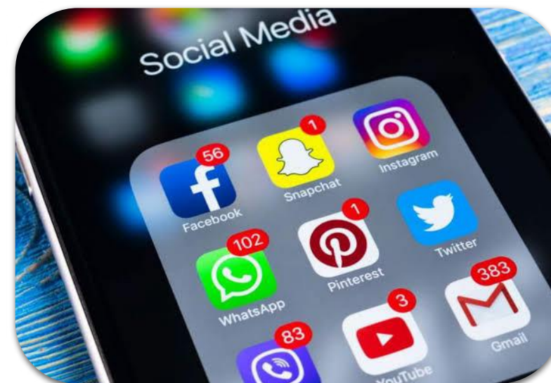
B. Liputan Kurasi dari Media Sosial

Baca buku Jurnalisme Online dari E. Wendratama Hal 100-115