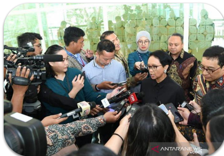
A. Liputan langsung di Lapangan