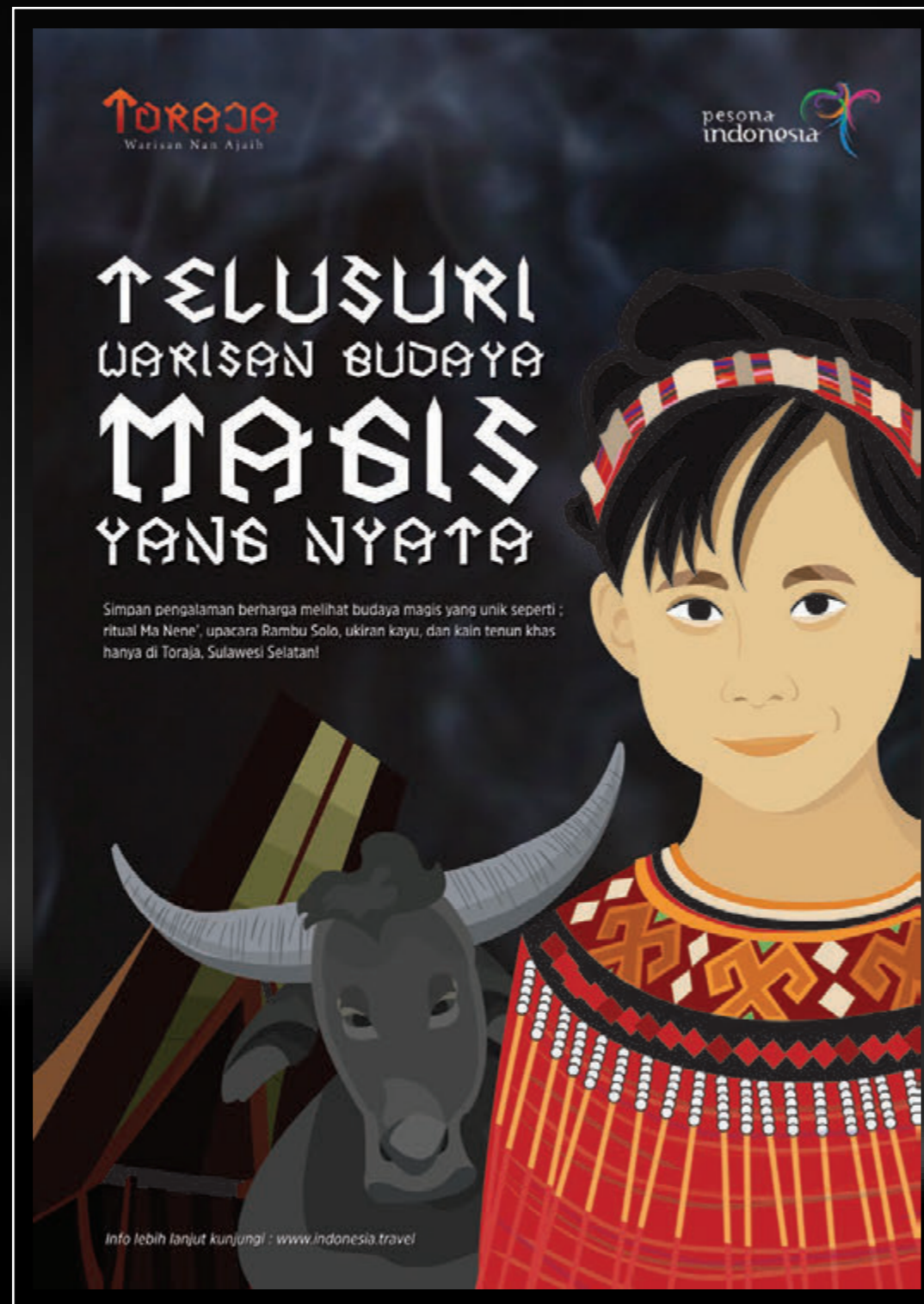
POSTER 1 Poster ajakan mengunjungi Toraja