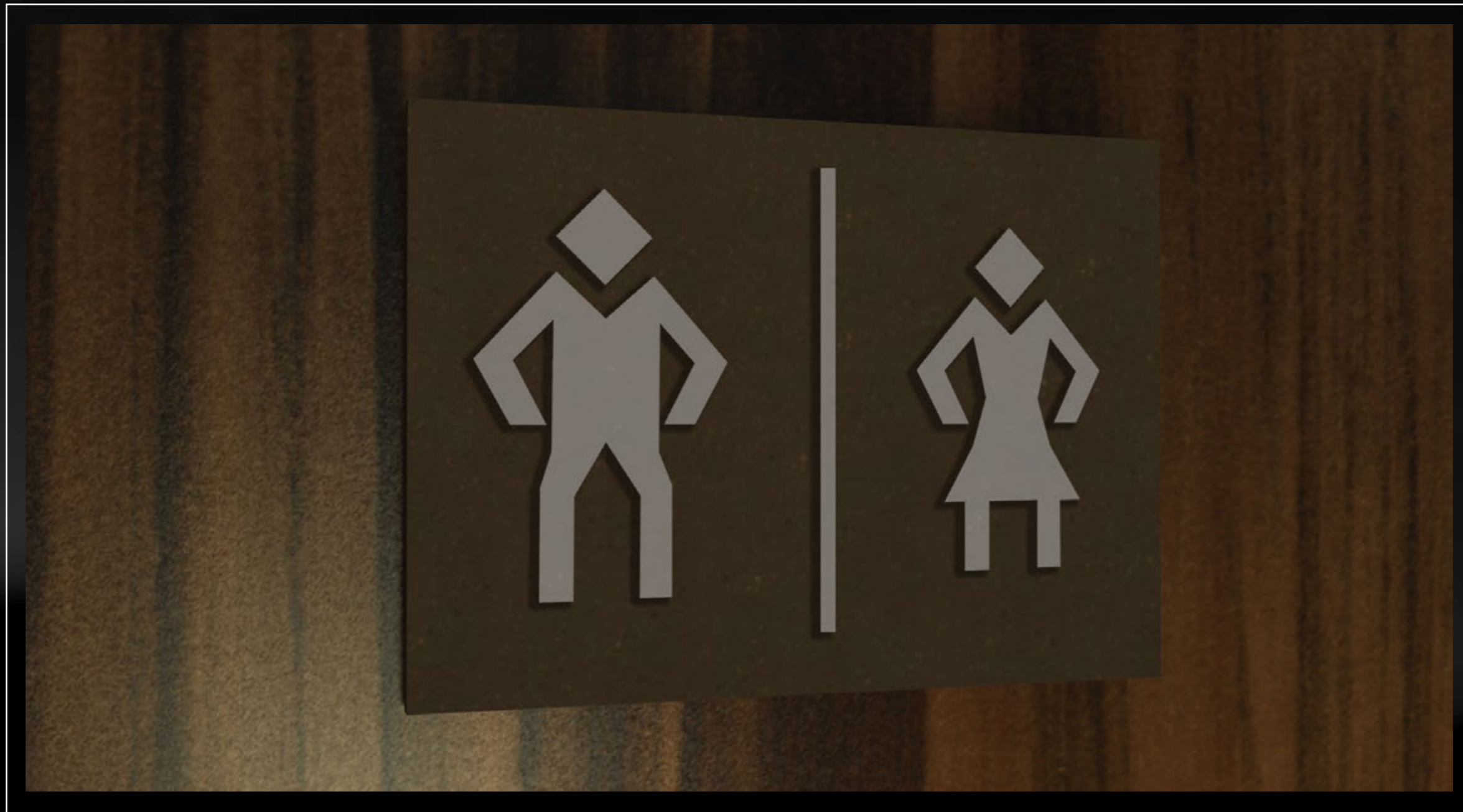
SIGNAGE 2 Penujuk kamar mandi di rest area tol

*SIGNAGE UNTUK DIPASANG DI KAWASAN REST AREA TOL MENUJU TORAJA