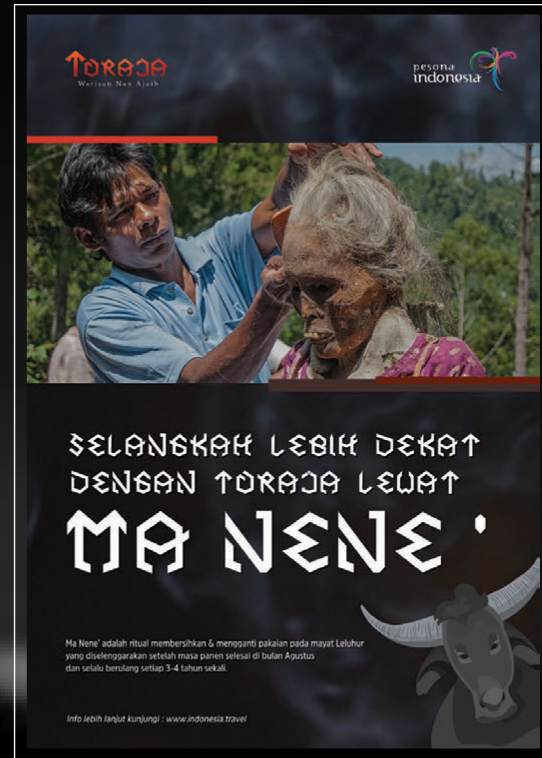
POSTER 2 Poster ajakan melihat ritual Ma Nene' secara langsung di Toraja