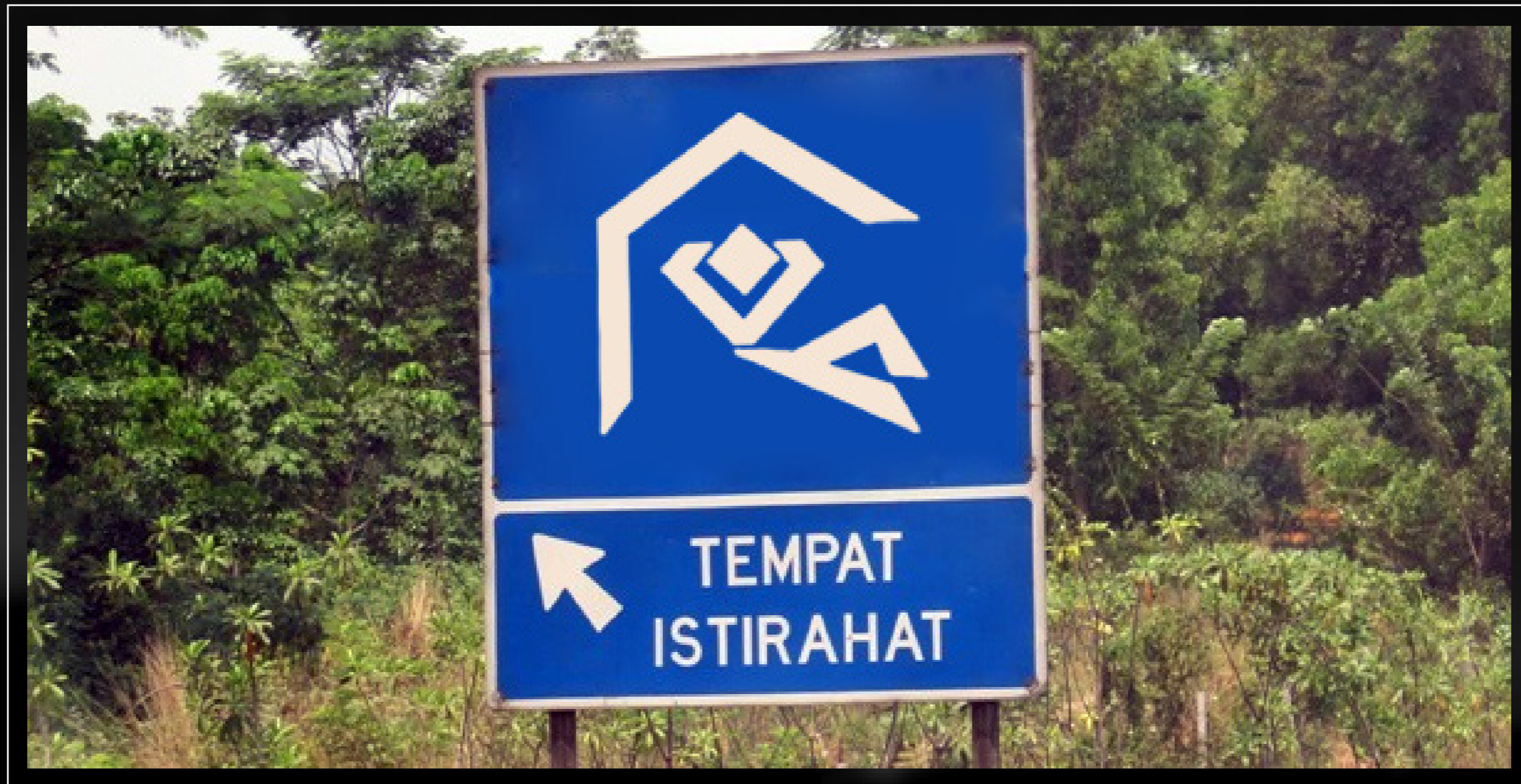
SIGNAGE 1 Penujuk tempat istirahat di kawasan tol (Rest Area)

*SIGNAGE UNTUK DIPASANG DI KAWASAN REST AREA TOL MENUJU TORAJA