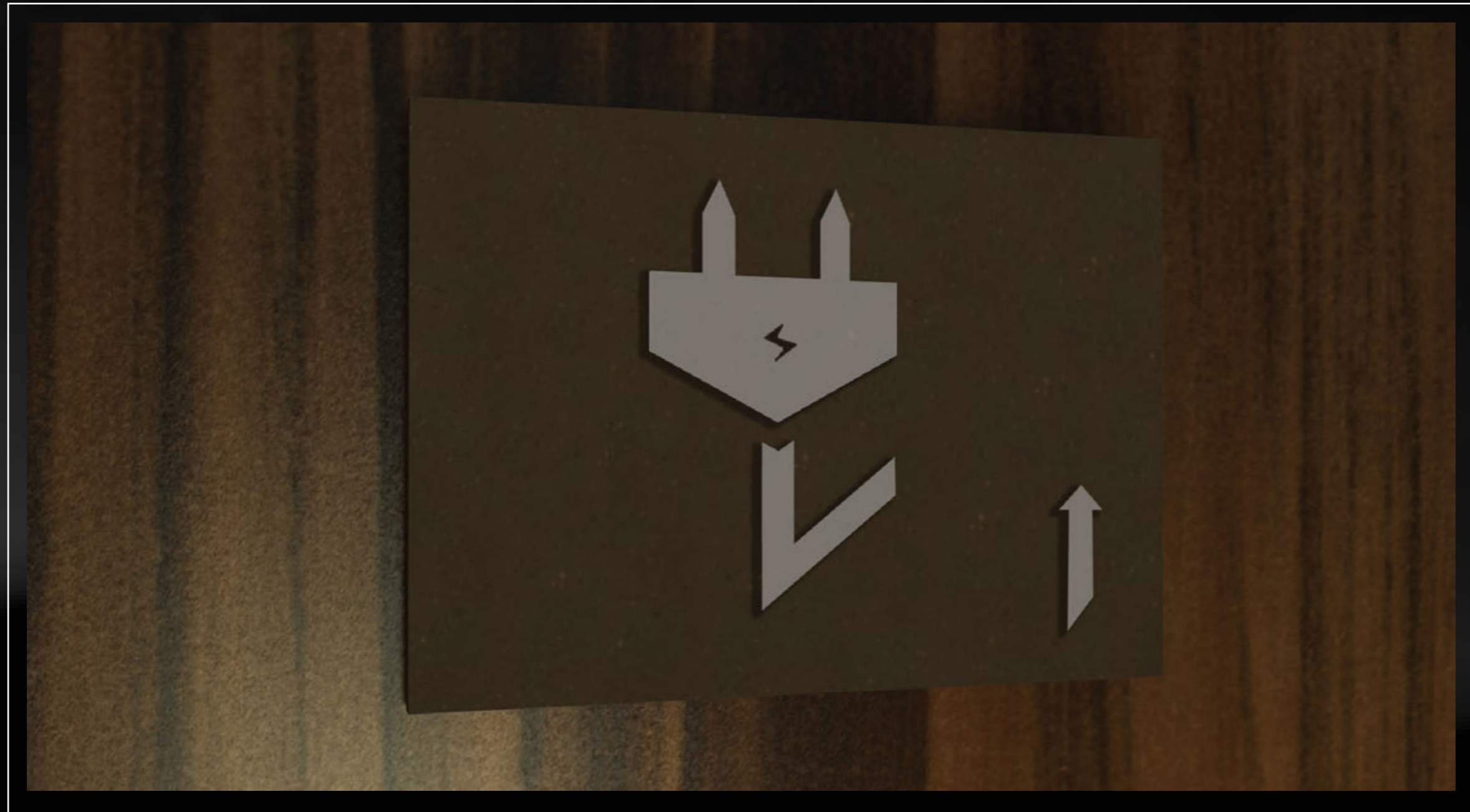
SIGNAGE 4 Penujuk tempat isi ulang daya baterai di rest area tol

*SIGNAGE UNTUK DIPASANG DI KAWASAN REST AREA TOL MENUJU TORAJA