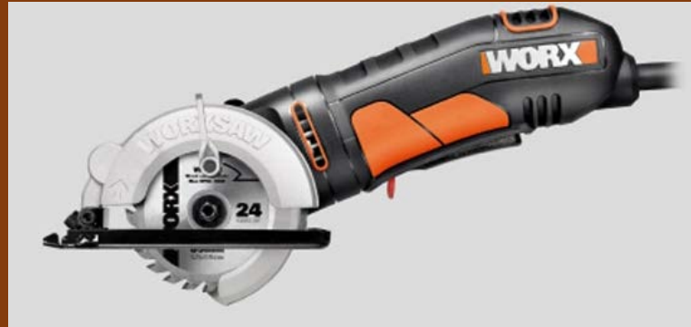
Hand saw portable