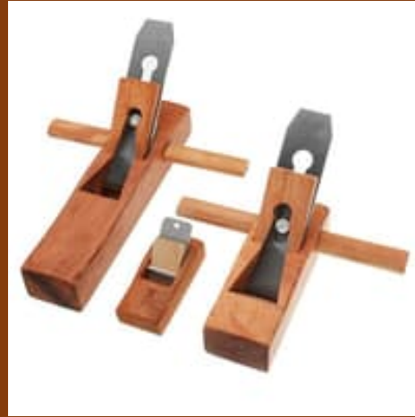
Push Planer Tukang Kayu