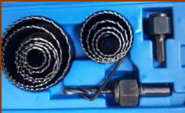
Hole saw benz