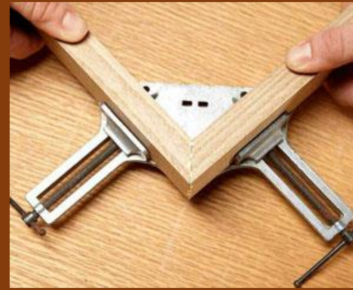
Mistar siku kayu