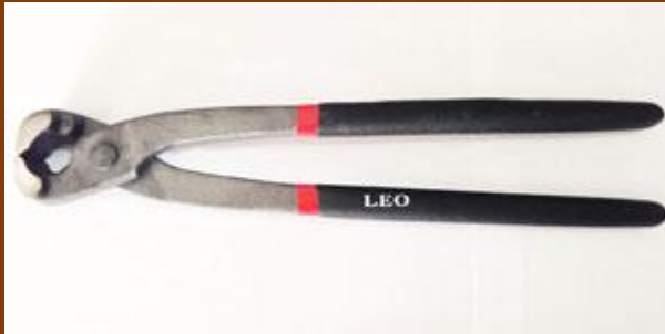
Tank atau catut