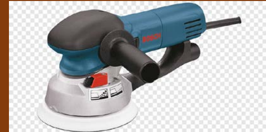
Belt sander portable