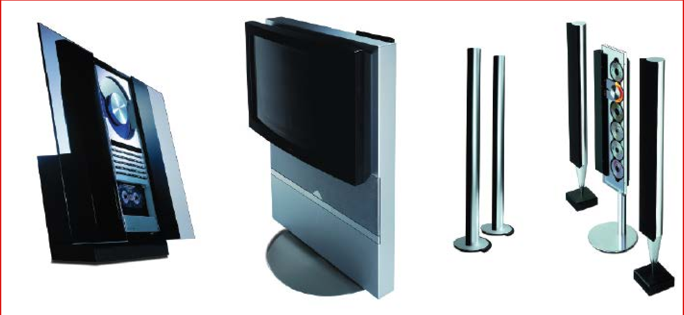
Bang & Olufsen

Kesan produk dari segi visual dan kualitas permukaan benda. Cahaya dan karakter