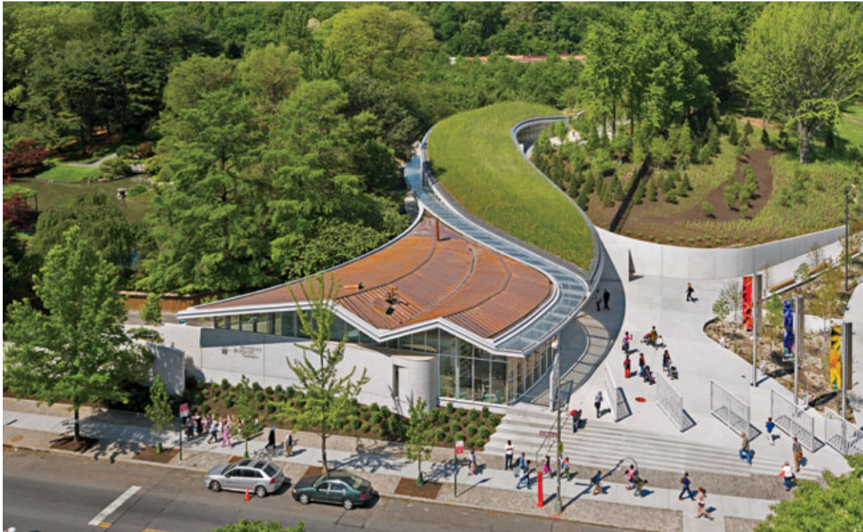
Brooklyn Botanic Garden Visitor Center